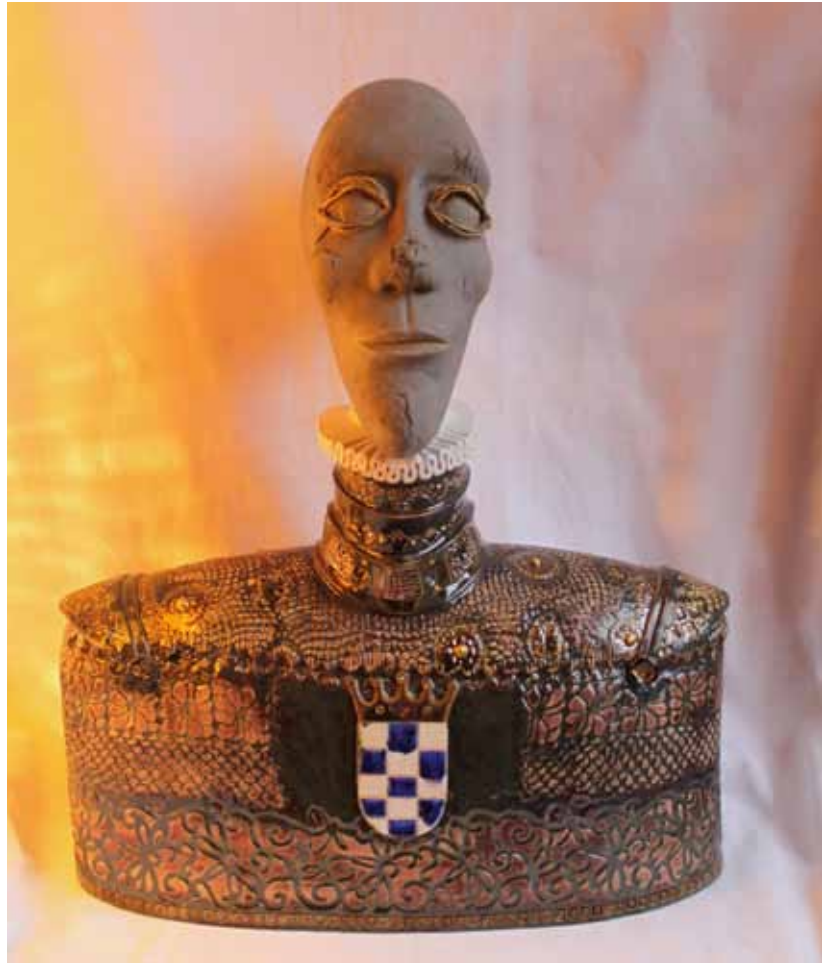
EL ALMA DEL DUQUE DE ALVA (DE ZIEL VAN DE HERTOG VAN ALVA) 45x50 cm

Aardewerk/steengoed Oxiderend gebakken 1040 en 1250°C metallic glazuur Handgevormd