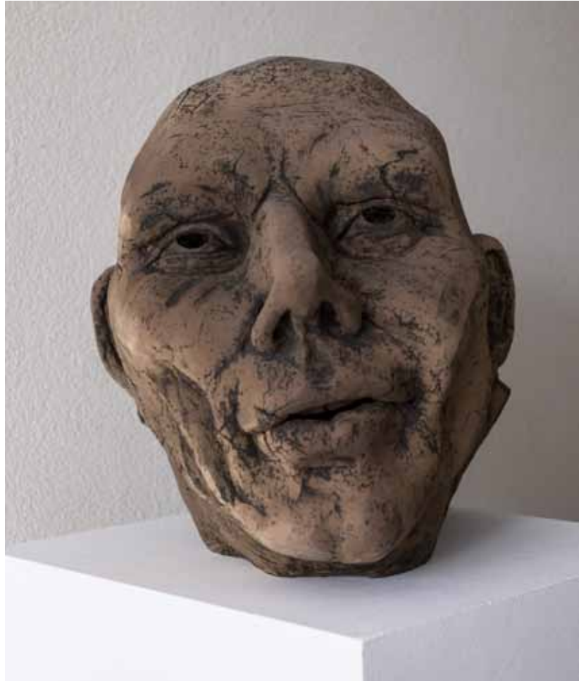
BELIEVER 55 x 58 x 58 cm

aardewerk Oxiderend gebakken 1080° Sinterengobe Hand opgebouwd