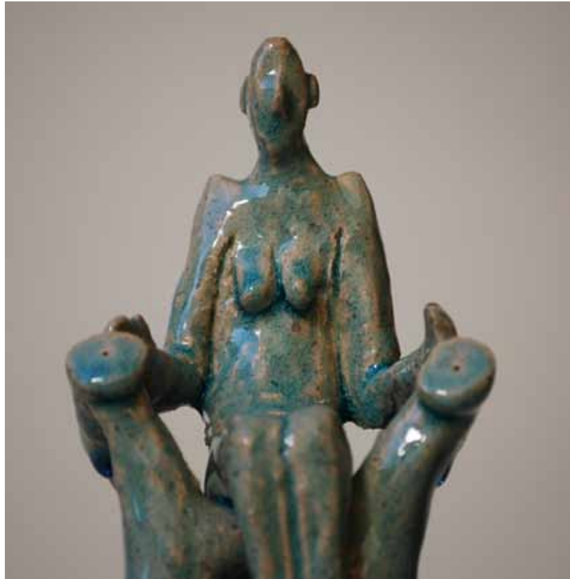
VERLIES 18x12x12 cm / 42x20x20 cm in installatie Aardewerk Oxiderend gebakken 1060°C Handgevormd