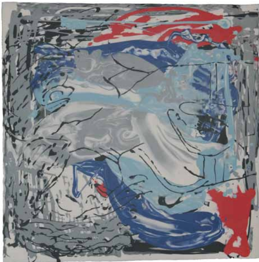
HARTSTOCHT 2017 45x45 cm

Porselein Oxiderend gebakken 1260° Hand opgebouwd